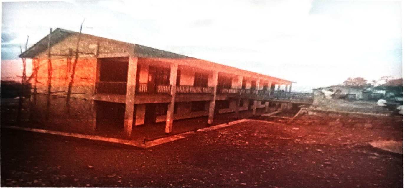
L'edificio da finire: